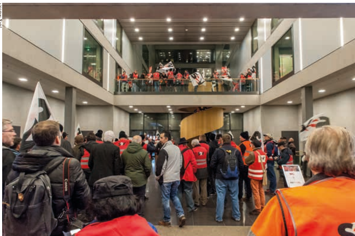
Les membres du SEV ont manifesté leur opposition à RailFit 20/30 au siège des CFF le 22 novembre 2016