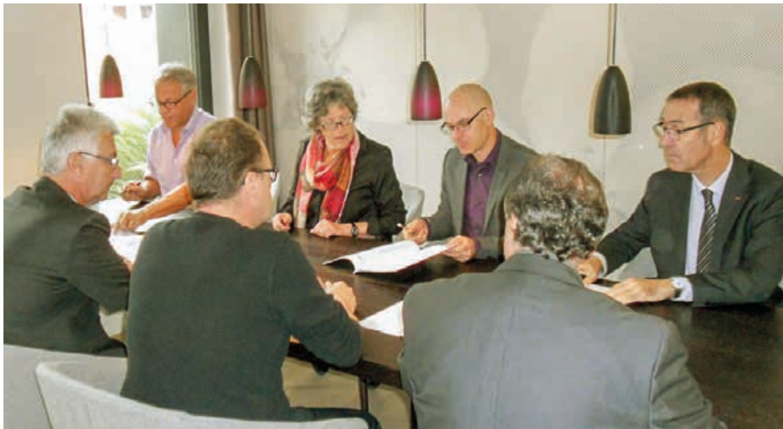
En 2016, Thurbo et le SEV se mettent d'accord sur une nouvelle CCT

d'efforts pour sauver la semaine de vacances supplémentaire et le temps de travail accessoire pour le personnel de locomotive, de train et de gare. Autre nouveauté: une durée minimale des équipes de 360 minutes pour le personnel de locomotive, de train et de gare, et l'augmentation du nombre minimal de jours libres à 108. Malgré son scepticisme, l'assemblée générale de la section SEV RhB a approuvé la nouvelle convention d'entreprise; mais elle a aussi adopté une résolution dans laquelle elle exige l'annulation de l'augmentation du temps de travail «dès que la situation monétaire l'autorisera». Les négociations salariales de l'automne 2015 avaient été dominées par les malaises de la caisse de pensions. Mais la réduction du taux technique avait pu être compensée par diverses mesures correctrices, qui ont eu pour effet qu'on a procédé par anticipation aux négociations salariales pour la période 2016-2019.