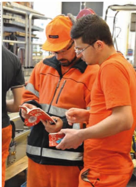
Le SEV-Info est apprécié par les collègues des ateliers industriels d'Yverdon

Lors du dernier Congrès, au début de l'été 2015, l'action «Je suis aussi ...» a été lancée; dans ce cadre, un jeu de cartes a été édité. Les «paires de membres» figurant sur les cartes à jouer doivent faire remarquer que le SEV est un syndicat pluraliste dans lequel se retrouvent des membres de diverses professions et de diverses entreprises. Le SEV vit de chacun de ses membres: jeune ou moins jeune, homme ou femme, capitaine, employé à la manœuvre, vendeuse de voyages, mécanicienne de locomotives ou collaborateur d'administration, suisse ou étranger, actif ou pensionné: il les faut toutes et tous pour faire le SEV, ils et elles le font vivre!