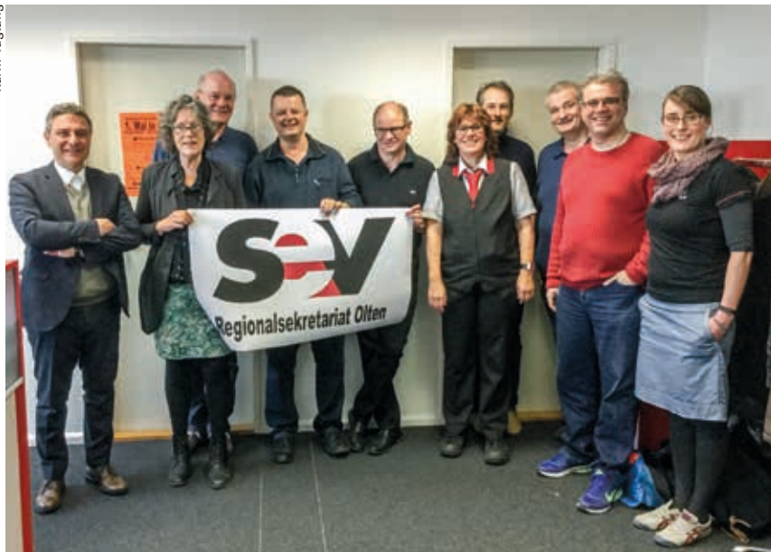
Le SEV a ouvert un secrétariat régional à Olten