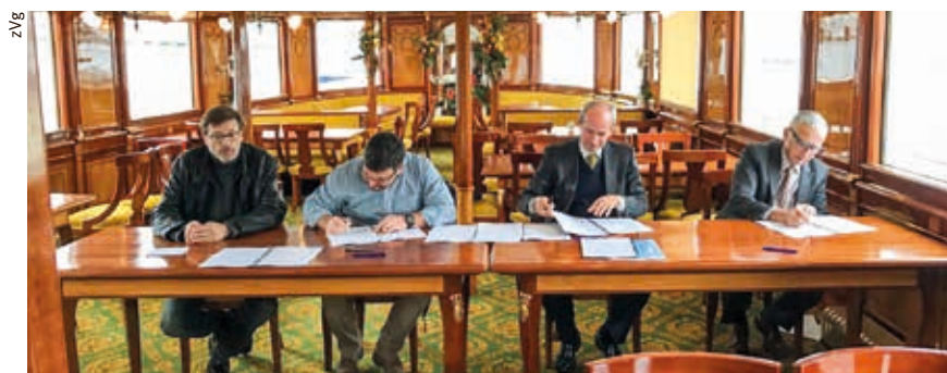
A bord de l'« Italie », la signature de la CCT CGN en 2016

constater que le SEV a pu non seulement développer les CCT existantes, mais aussi en conclure de nouvelles.